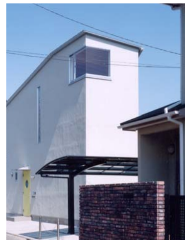
■ 台形平面の短辺は2mのシャープな外観。