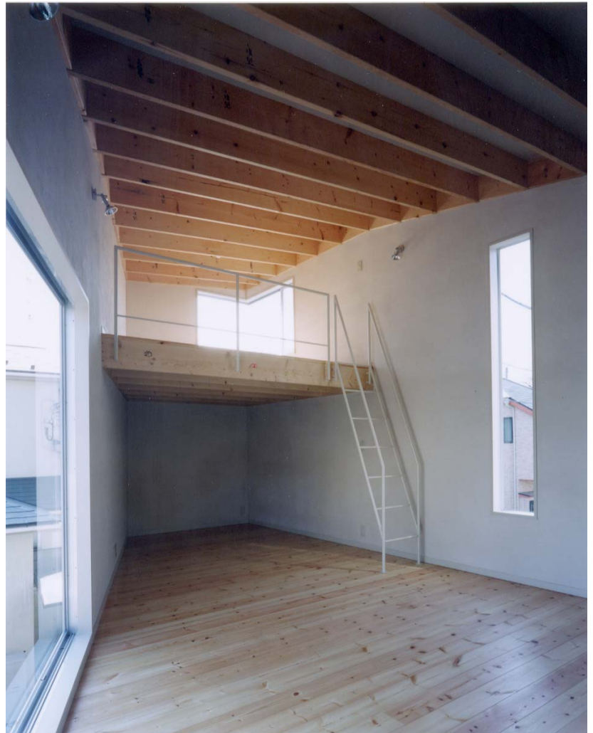
■居間。奥にロフトが見える。壁は珪藻土、床はパイン無垢材。