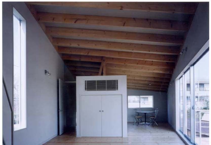
■居間よりキッチン方向を見る。