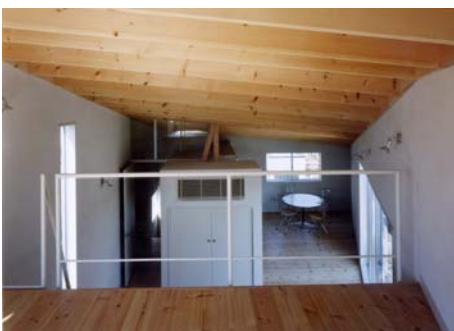
■ロフトよりキッチン方向を見る。