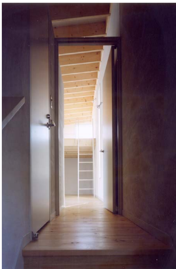
■ 階段室より居間方向を見る。