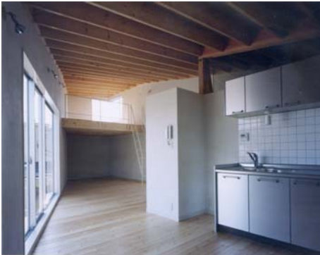
■キッチンより居間方向を見る。